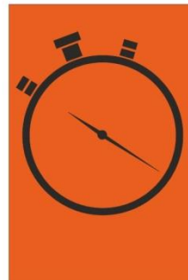
Tijdcontrole Tijdwisselcontrole (TWC)