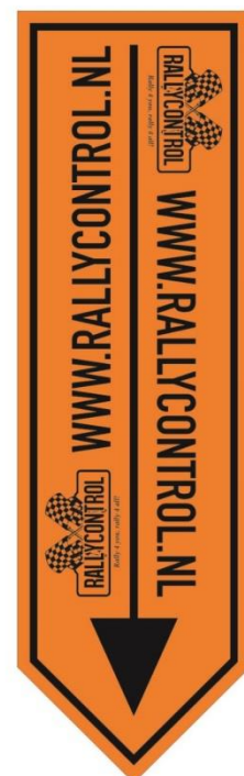
Pijl naar beneden wijzend weg mag niet worden ingereden.