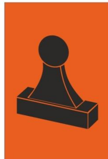
Zelfstempelaar (RC) Bemante (RC)