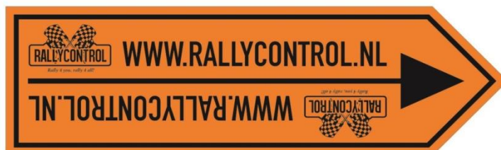
Dubbele pijl – einde omleiding / routerichting