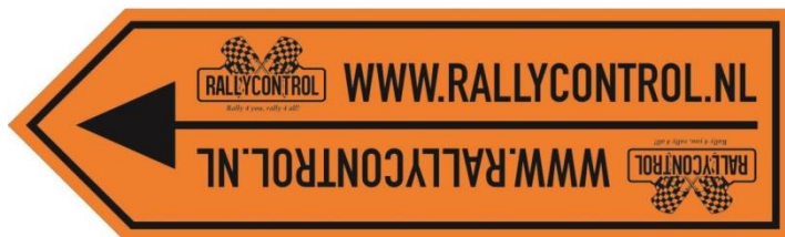
Dwangpijl (routerichting of omleiding)